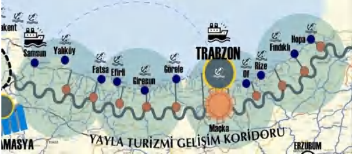
Şekil 1: Doğu Karadeniz Yayla Turizmi Gelişim Koridoru

Biyolojik çeşitlilik ve doğal kaynaklar açısından oldukça zengin olan bölge, Kültür ve Turizm Bakanlığı'nın hazırlamış olduğu Türkiye Turizm 2023 Stratejisi'nde yayla koridoru olarak gösterilmiştir. Samsun'dan Hopa'ya kadar olan alanda yayla turizminin geliştirilmesi ve alternatif turizm türleri ile birleştirilerek turistler için daha cazip hale getirilmesi önerilmiştir.